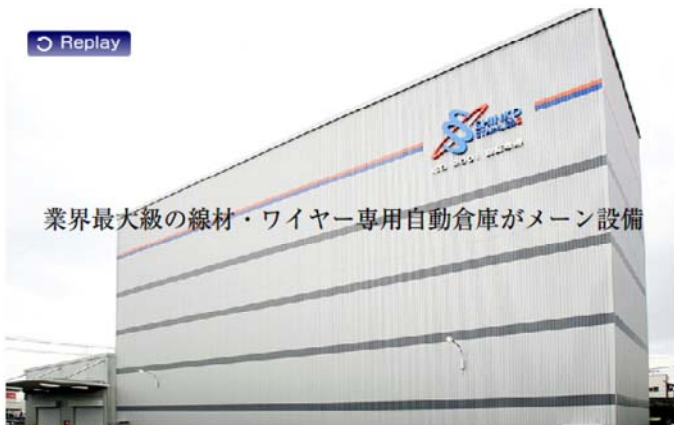
業界最大級の線材・ワイヤー専用自動倉庫がメイン設備