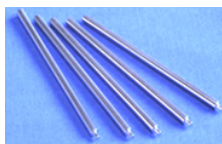
スライドシャフト