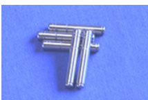
DVDスピンドルシャフト