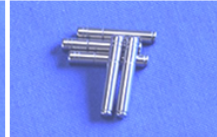
DVDスピンドルシャフト