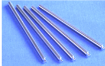
スライドシャフト